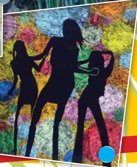
Neįgaliųjų jausmų spalvos